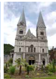
Kerk Sint-Remaclus Spa