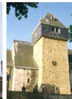
Kerk Sint-Hermes en Sint-Alexander Theux