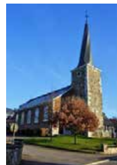
Eglise Saint Michel Jalhay