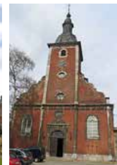
Eglise Saint Sébastien Stavelot